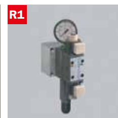
Reg. pressione morsa Adjustable vice pressure