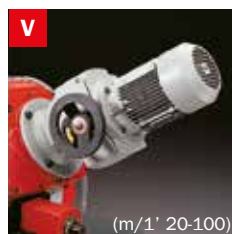
Motovariatore Blade speed variator