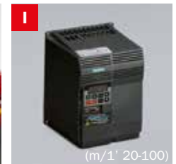
Inverter Frequency converter