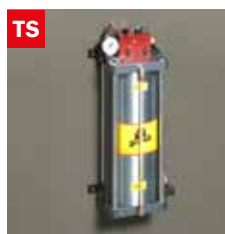
Dispositivo taglio a secco Dry cooling device