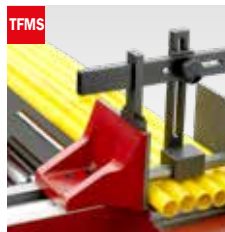
Taglio fascio meccanico Mechanical bundle clamping device