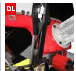
Dispositivo controllo deviazione lama Blade deflection control device